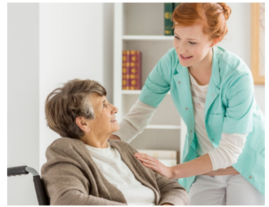
Figure RUG-III Plus

RUG-III Plus est une version à jour de la méthodologie de regroupement RUG-III. L'ICIS a travaillé avec les intervenants des autorités compétentes du Canada et interRAI pour élaborer RUG-III Plus.